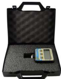
VALIGETTA IN ABS ABS CASE